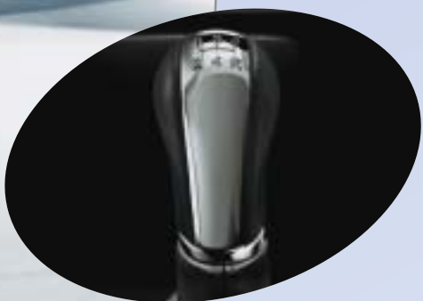
Växelspaksknopp i läder och krom.