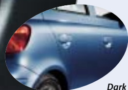
Dark Blue Mica Metallic 8P4