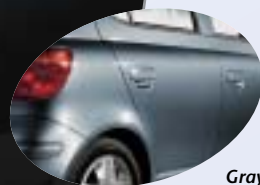
Grayish Blue Metallic 8S5