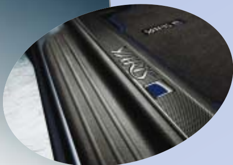
Instegslistor med Yaris Blue logotype.