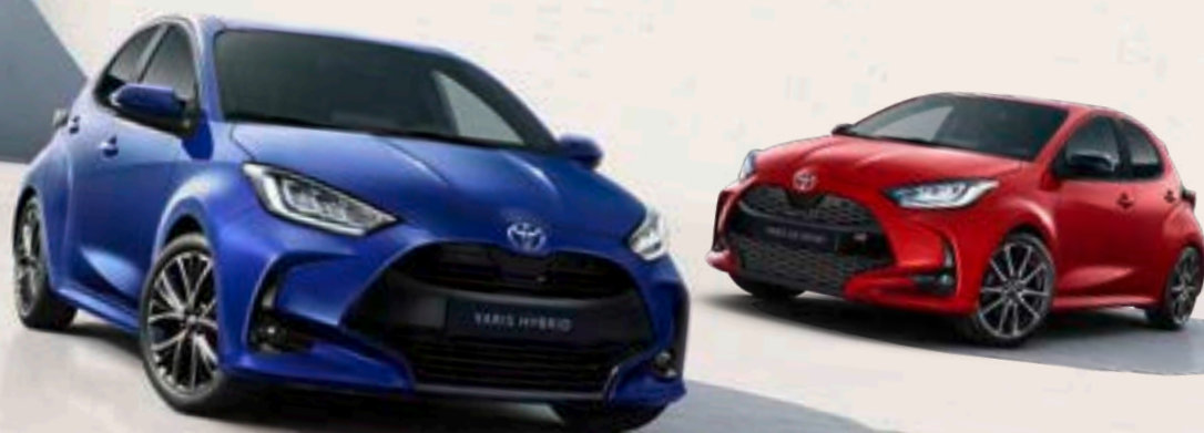
Yaris monotone lackfärger