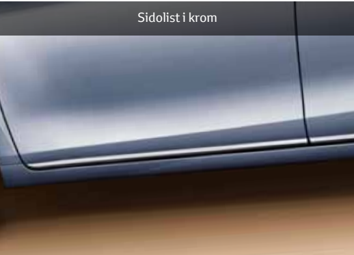
Sidolist i krom