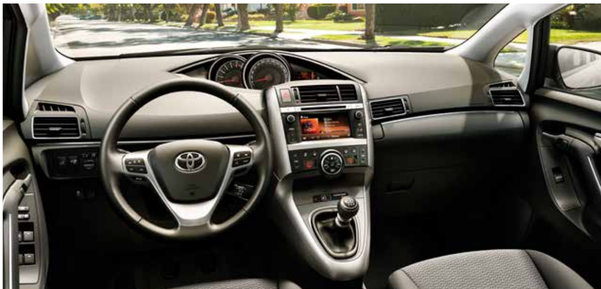
Verso är stor och rymlig inuti, utan att det märks utanpå