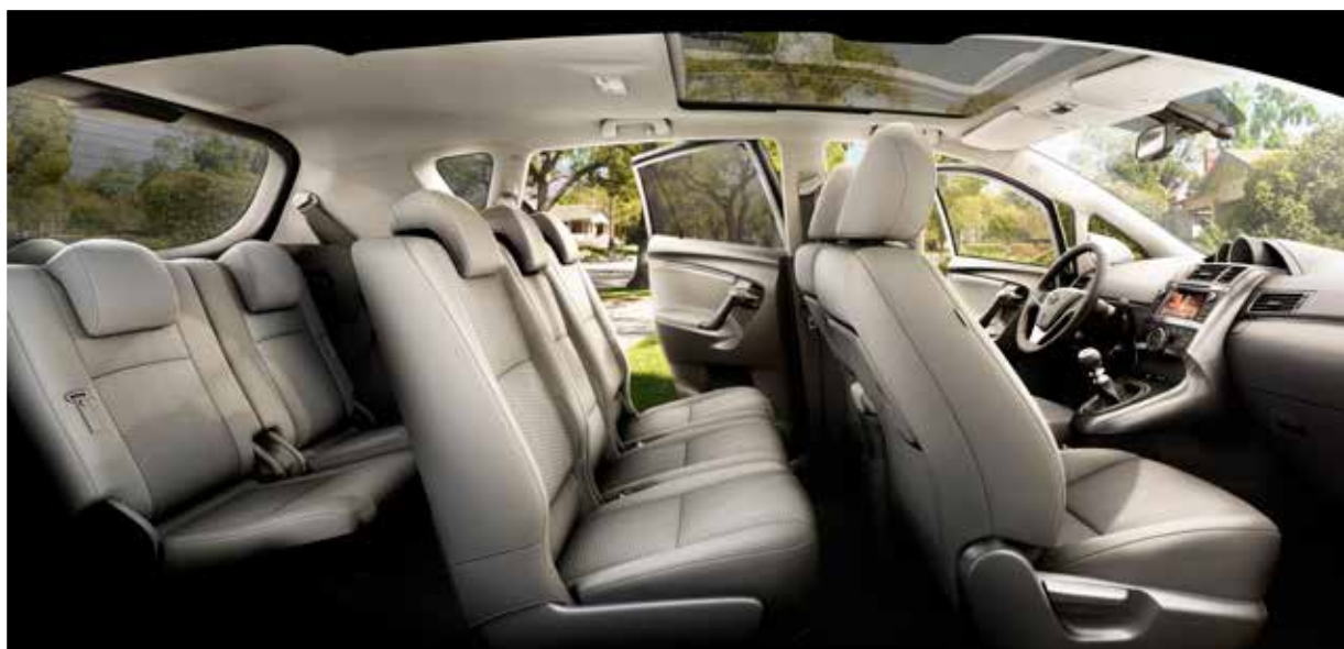
Tillval: Leather bolster seats & Skyview panoramaglastak