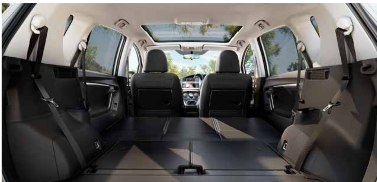
Med tillvalet Skyview känns Verso extra luftig