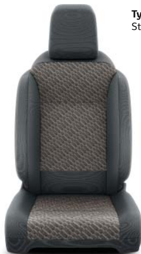
Tygklädsel, brun Standard på Premium