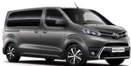
EVL Dark Grey