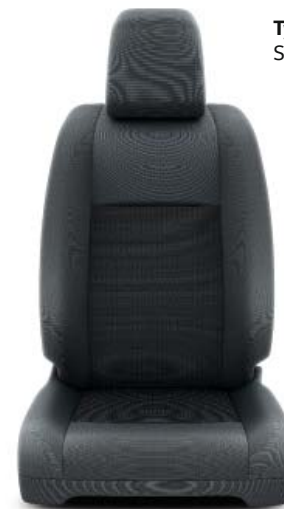
Tygklädsel, mörkgrå Standard på Shuttle