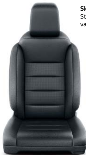
Skinnklädsel, svart Standard på Executive, valbar på Premium