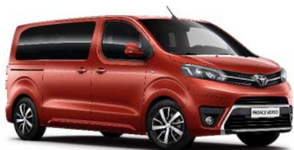
KHK Orange Tourmaline