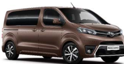
KCM Brown Rich Oak