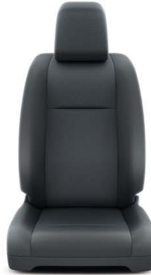
Tyg, mörkgrått (43FT) Standard på Dubbelhytt, Comfort, Professional