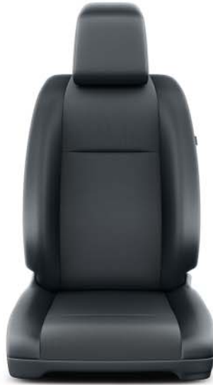
Tyg, mörkgrått Standard på Comfort, Professional