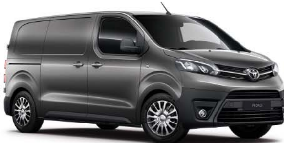
EVL Dark Grey*