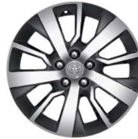
Fälgar 17 tum, lättmetall maskinbearbetade (5-dubbelekrade) Standard på Professional