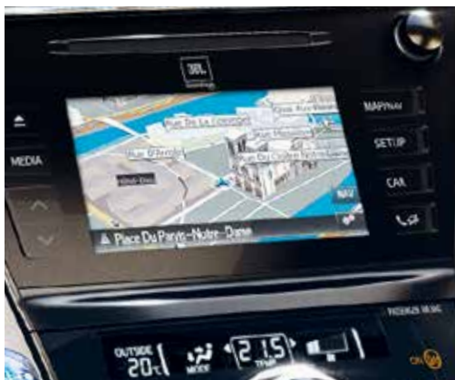
Navigator ToyotaTouch 2 & Go