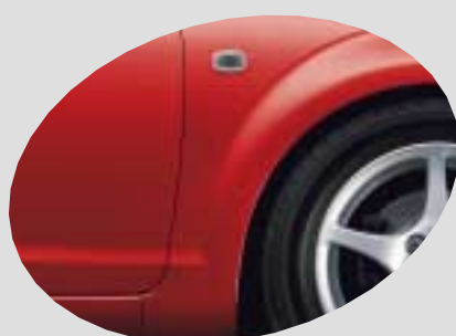
3P0 Super Red V