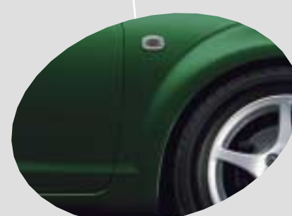
6R4 Dark Green Mica*