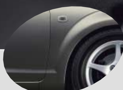
1E3 Grey Mica Metallic*