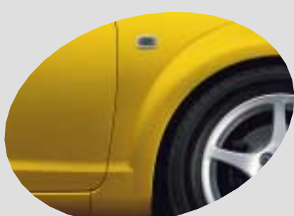
576 Super Bright Yellow