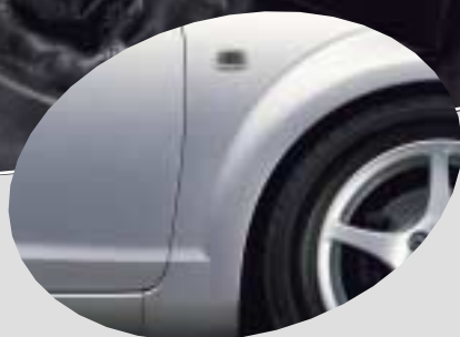
1E7 Silver Mica Metallic*