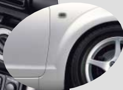
040 Super White