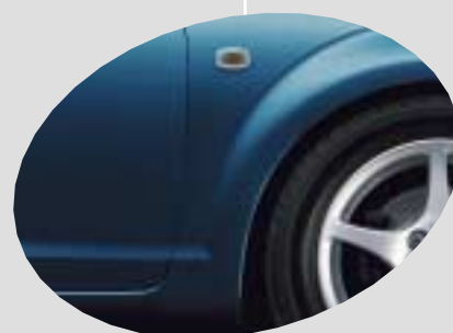
8M6 Blue Mica*