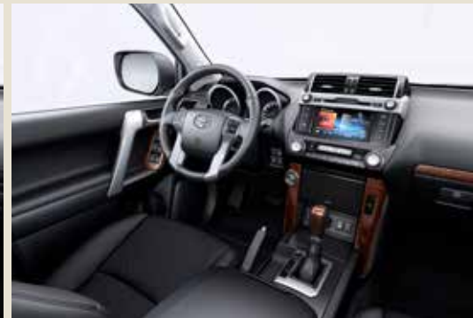
Active (Tygklädsel) BusinessPlus (Skinnklädsel)