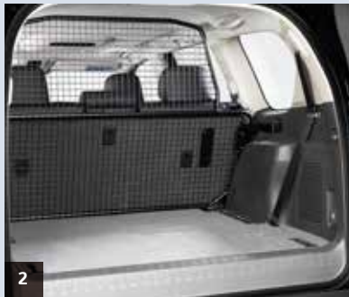
2. Helt bagagerumsgaller Skapar ett säkert avskilt utrymme för t ex hunden.