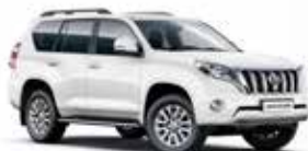
040 Super White*