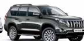
1G3 Grey Metallic