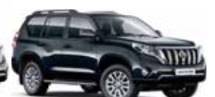
1H2 Dark Steel Mica