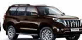
4X4 Vintage Brown Pearl ◊