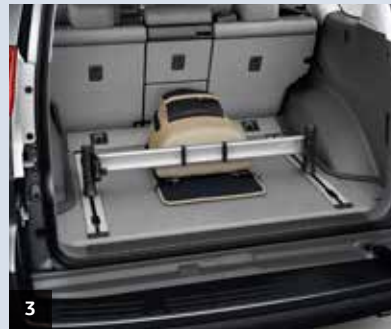
3. Bagagehanteringssystem Kläms fast i skenorna på golvet.