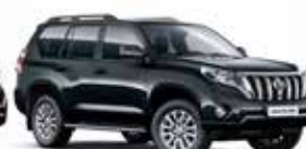
218 Attitude Black Mica/Eclipse