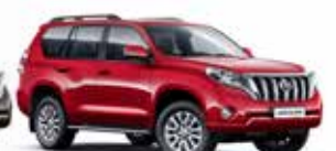
3R3 Red Mica Metallic