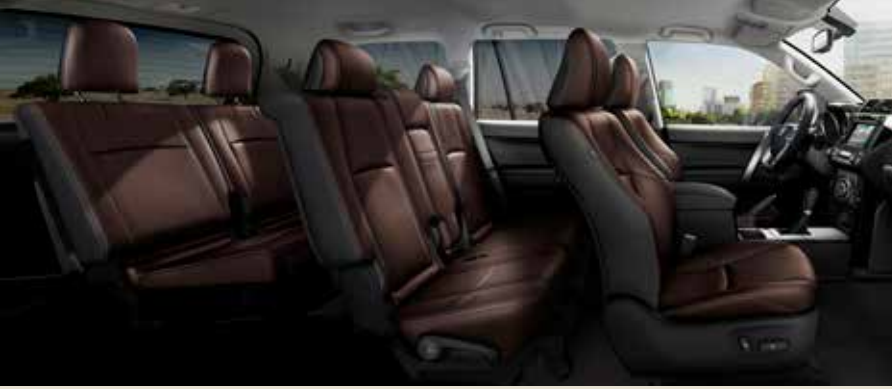
Invincible, 7 säten, med ColourPack