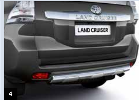
4. Underredsskydd bak