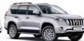
1F7 Silver Metallic