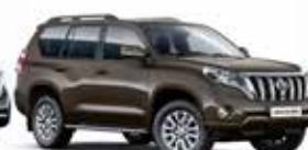
4T3 Bronze Mica Metallic