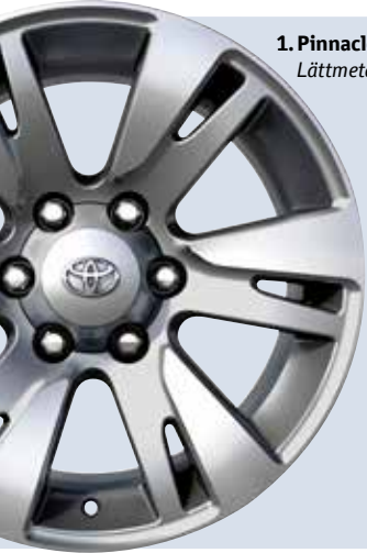
1. Pinnacle, 18" Lättmetallfälg.