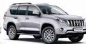
1F7 Silver Metallic