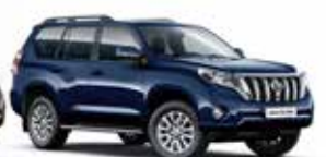
8S6 Dark Blue Mica