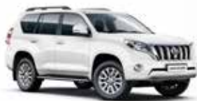
040 Super White*