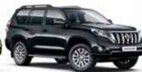
218 Attitude Black Mica/Eclipse