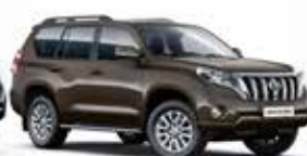
4T3 Bronze Mica Metallic