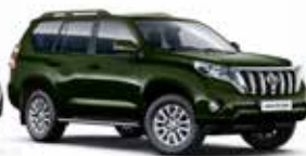
6V4 Dark Green Mica