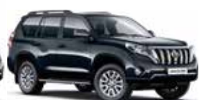
1H2 Dark Steel Mica