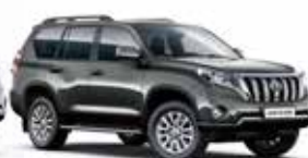
1G3 Grey Metallic