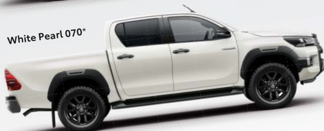
White Pearl 070*