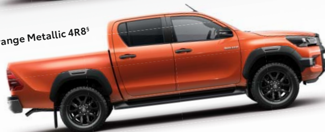
Orange Metallic 4R8 §