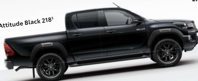
Attitude Black 218 §