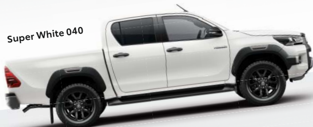
Super White 040