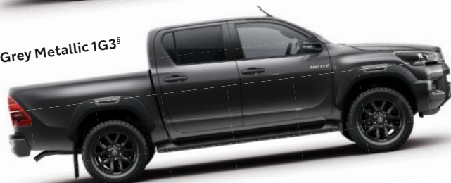
Grey Metallic 1G3 §