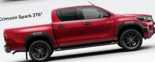
Crimson Spark 3T6 §