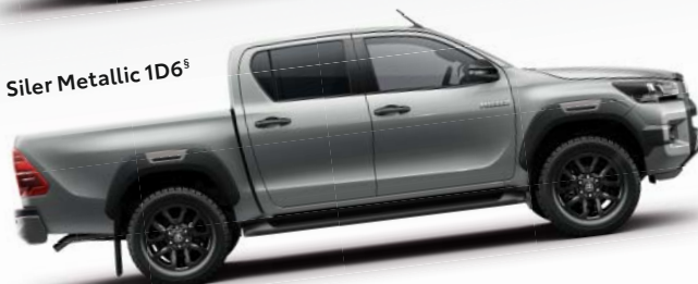
Siler Metallic 1D6 §