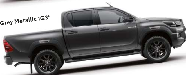
Grey Metallic 1G3 §