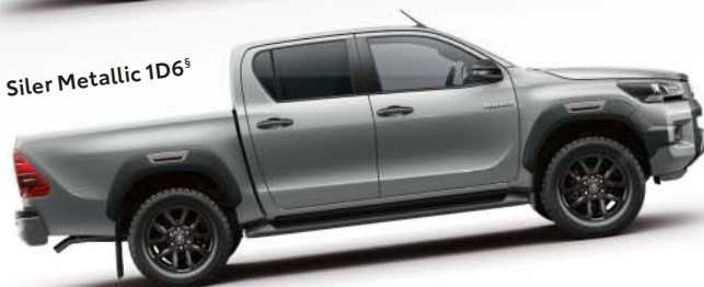
Siler Metallic 1D6 §