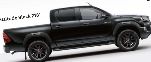
Attitude Black 218 §