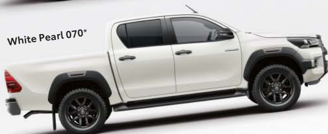
White Pearl 070*