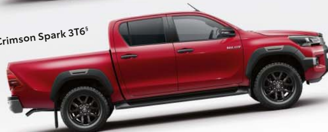
Crimson Spark 3T6 §