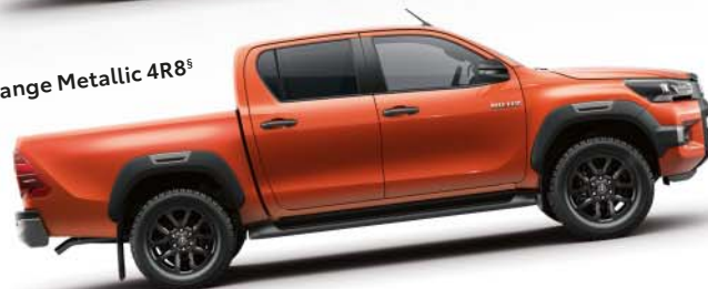
Orange Metallic 4R8 §