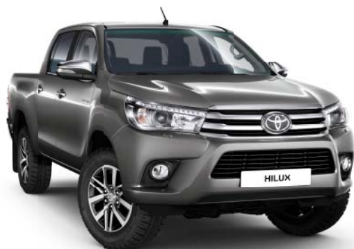
1G3 Grey Metallic °