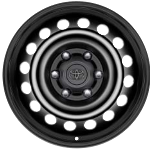
Fälgar 17 tum, stål (svarta) Standard på Legend*