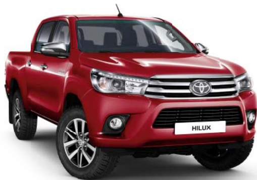
3T6 Crimson Spark Red Metallic o