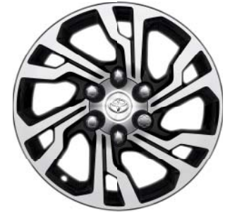
Fälgar 17 tum, lättmetall, svarta maskinbearbetade (6 dubbel-ekrad) Tillbehörsfälg till Legend, Invincible, Premium