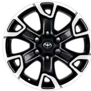
Fälgar 18 tum, lättmetall, svarta maskinbearbetade (6-ekrad) Tillbehörsfälg till Legend, Invincible, Premium