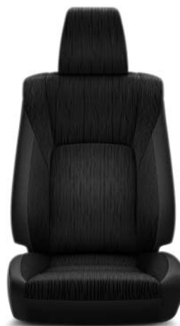
Tyg, svart med vertikalt mönster (FK20) Standard på Invincible, Premium