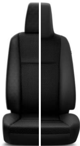
Tyg, svart med ovalt mönster (FG20) Standard på Legend