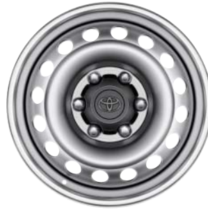
Fälgar 17 tum, stål (silverfärgade) Standard på Legend §