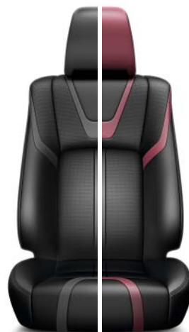
Mörkgrå skinnklädsel/Svart skinnklädsel med mörkrosa inslag Tillgänglig för samtliga utrustningsnivåer