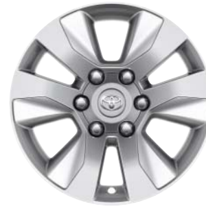
Fälgar 17 tum, lättmetall (6-ekrad) Standard på Invincible