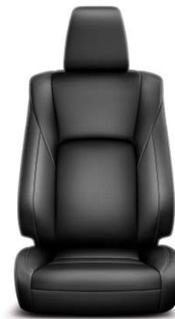
Skinn, svart perforerat (LE21) Standard på Ultimate