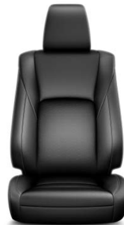
Skinn, svart (LA20) Standard på Premium