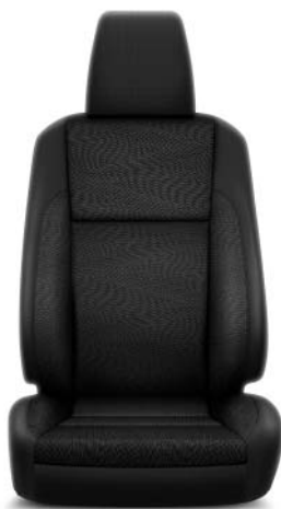
Tyg, svart med horisontellt mönster (FJ20) Standard på Invincible