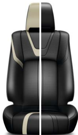
Svart skinnklädsel med beigea inslag/Svart skinnklädsel Tillgänglig för samtliga utrustningsnivåer