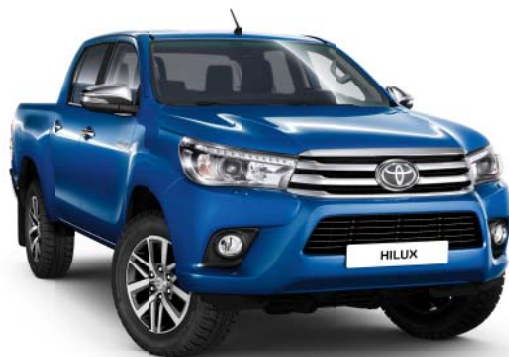
8X2 Nebula Blue Metallic °