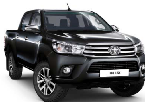
218 Attitude Black Metallic °