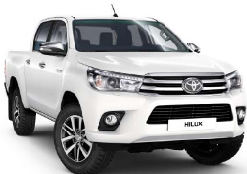
040 Super White