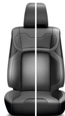
Grå skinnklädsel/Grå skinnklädsel med mörkgrå inslag Tillgänglig för samtliga utrustningsnivåer