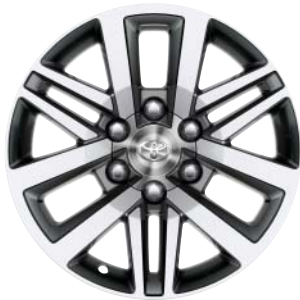
Fälgar 18 tum, lättmetall, grå/ maskinbearbetade (6-ekrad) Standard på Premium, Ultimate