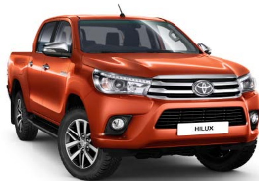
4R8 Orange Metallic o

Bilderna är illustrationer och avser endast att visa tillgängliga färger.