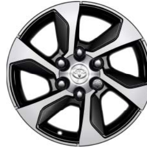
Fälgar 17 tum, lättmetall, svarta maskinbearbetade (6-ekrad) Tillbehörsfälg till Legend, Invincible, Premium