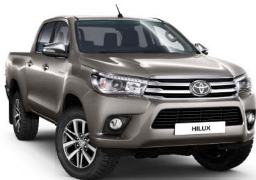
4V8 Avant-garde Bronze Metallic °