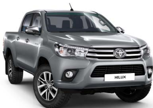
1D6 Silver Metallic °