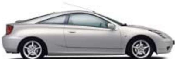
040 Super White II

Celica finns i sju läckra färger som alla matchar bilens sportiga framtoning. Vilken färg är rätt för just dig?