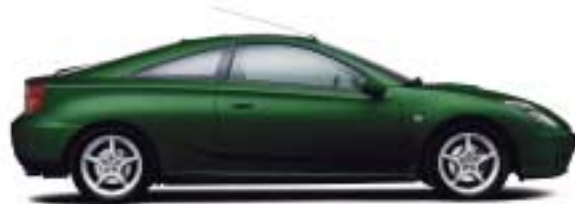
6R4 Dark Green Mica