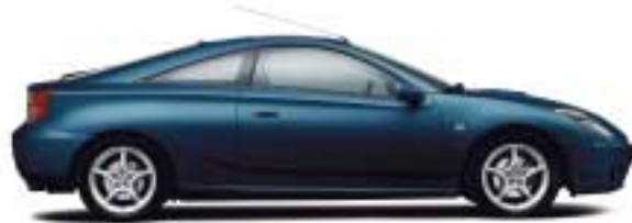
8M6 Blue Mica