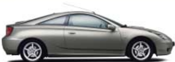
1D2 Grey Metallic