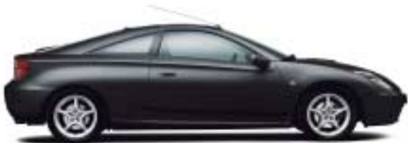
210 Blue Black Mica CC