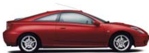
3P0 Super Red V