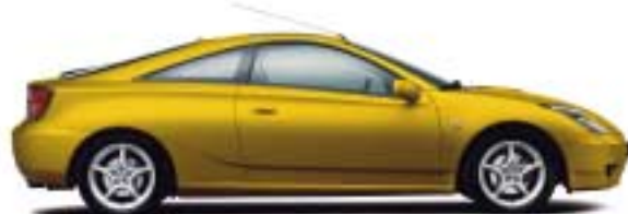
576 Super Bright Yellow