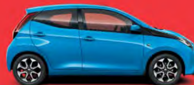
8W9 Cyan Metallic §**