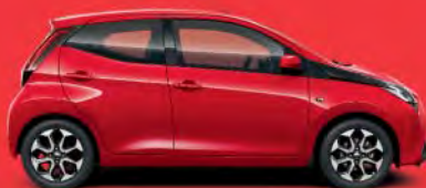
3P0 Super Red*