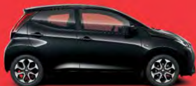
211 Black Mica §**