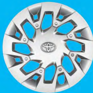
Fälgar, 15 tum stål med heltäckande hjulsidor Standard på x-play