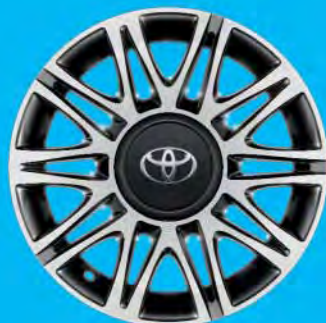
Fälgar, 15 tum lättmetall maskinbearbetade Standard på x-clusiv