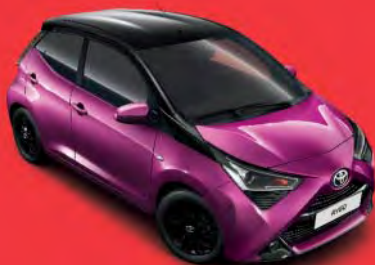
9AC Reddish Purple M.M §§