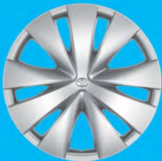
Fälgar, 14 tum stål med heltäckande hjulsidor Standard på x