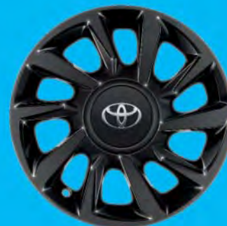
Fälgar, 15 tum lättmetall svarta blanka Standard på Selection