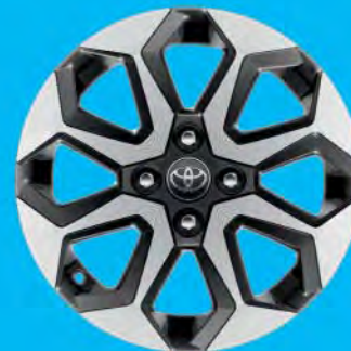
Fälgar, 15 tum lättmetall maskinbearbetade Tillval via paket till x-play