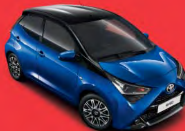
8Y5 Blue ME §°°