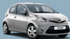
1E7 Silver Mica