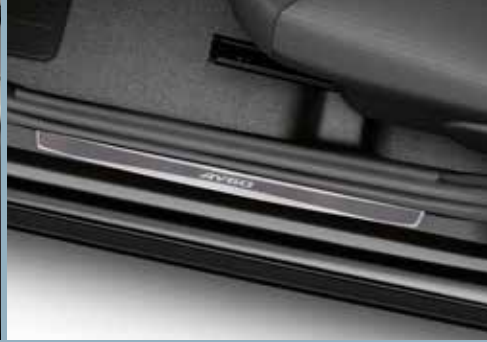
Instegsskydd i aluminium