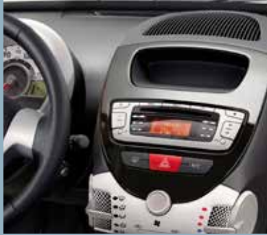
Applikation instrumentpanelens mitt