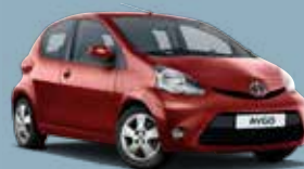
3P0 Super Red V*