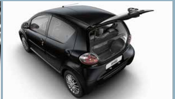
Sidoskyddslist och stötfångarskydd bak