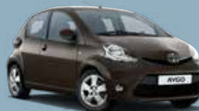
4T3 Bronze Mica