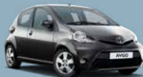
1E0 Dark Grey