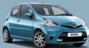
8V7 Cool Soda