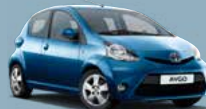
8U7 Blue Metallic