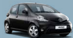
211 Black Mica