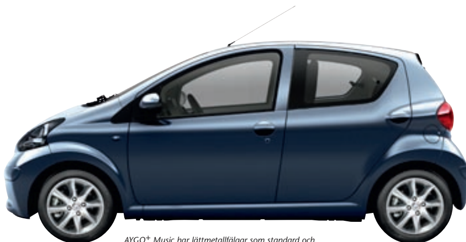
AYGO + Music har lättmetallfälgar som standard och känns även igen på sin blå lackfärg 8R3.

Toyotas energideklaration för nya bilar följer Konsumentverkets förslag och underlättar ett miljömässigt vettigt bilval.