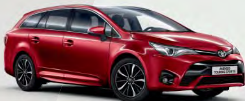
3T3 Tokyo Red*