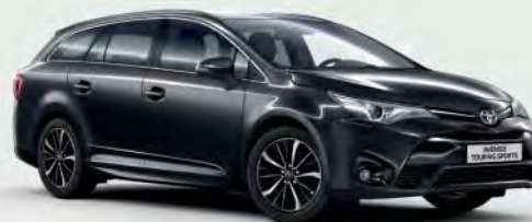
209 Black Mica 5