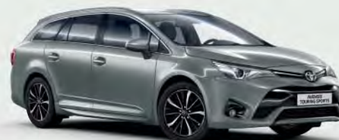
1H5 Manhattan Grey §