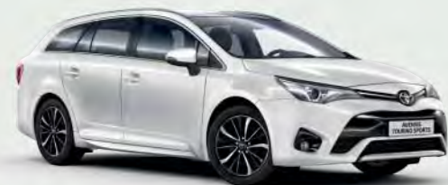
040 Super White