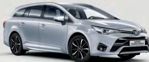
1F7 Silver Metallic §