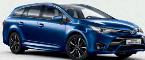
8T5 Dark Blue Mica §