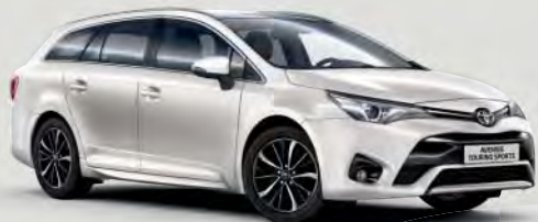
070 White Pearl*