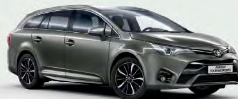
1G2 Platinum Bronze 5