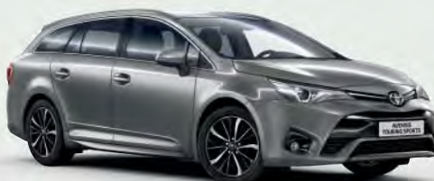
1G6 New Medium Silver/Grey §