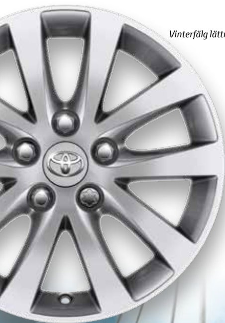
Vinterfälg lättmetall 16"