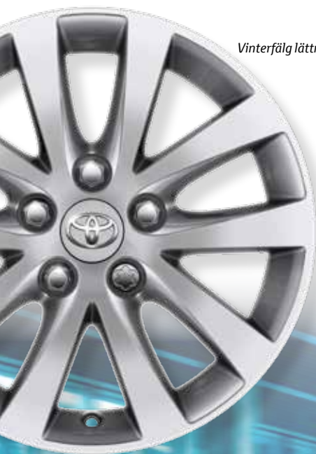
Vinterfälg lättmetall 16"