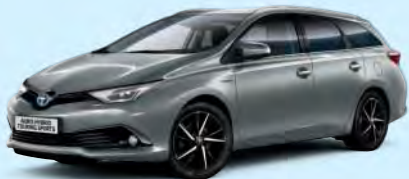
1H5 Manhattan Grey*