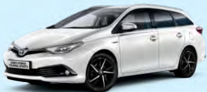
040 Super White*

Färg är personligt. Vårt utbud av lackfärger gör chansen stor att du hittar din favoritfärg till din Auris Touch & Go Edition.