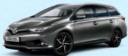
1G2 Platinum Bronze*