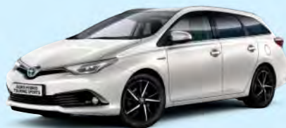
070 White Pearl §