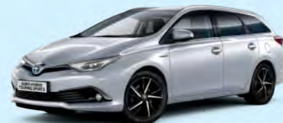
1F7 Silver Metallic*