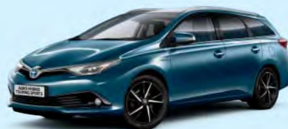
8U6 Blue Metallic*