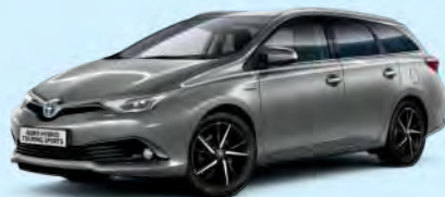
1G6 Grey Metallic*