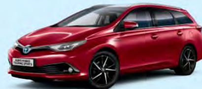
3T3 Tokyo Red §