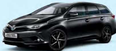
209 Black Mica*