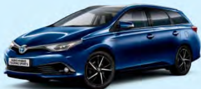
8T5 Dark Blue Mica*