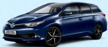
8Q4 Dark Blue