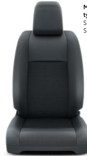
Mörkgrå tygklädsel (43FT) Standard på Shuttle