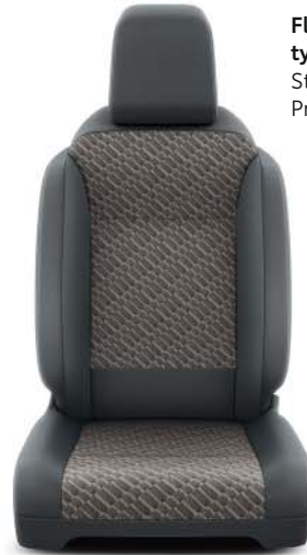
Flerfärgad tygklädsel (0UFY) Standard på Premium