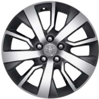
Fälgar 17", lättmetall, maskinbearbetade, 5-dubbelekrade Standard på Executive, Premium