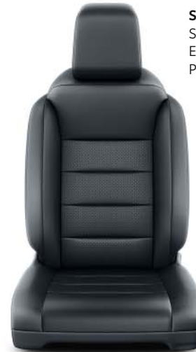
Svart läder (CYFX) Standard på Executive. Tillval Premium