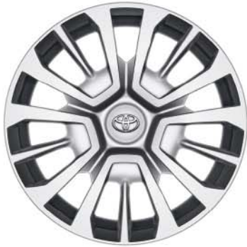
Fälgar 16", stål med hjulsidor (5-trippelekrad) Standard på Shuttle