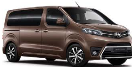
KCM Brun Rich Oak*

Bilderna är illustrationer och avser endast att visa tillgängliga färger.