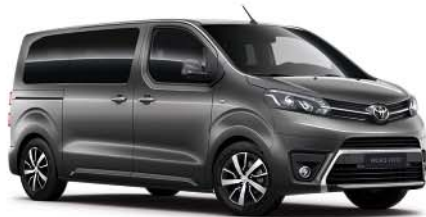
EVL Grå Platinum*