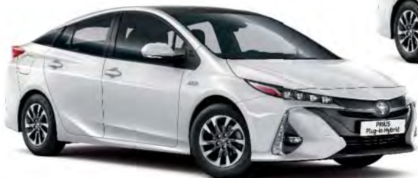
040 Super White