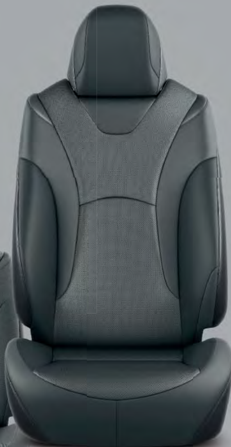
Skinnklädsel, svart (LA20) Tillval på Executive