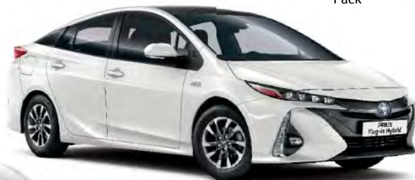
070 White Pearl*