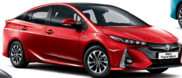
3T7 Emotional Red*