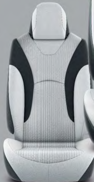
Tyglädsel, grå med svarta detaljer (FA10) Standard på Active, Executive, Solar Pack