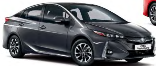
1G3 Grey Metallic §