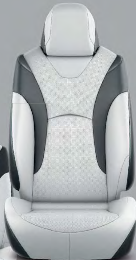
Skinnklädsel, grå med svarta detaljer (LA10) Tillval på Executive