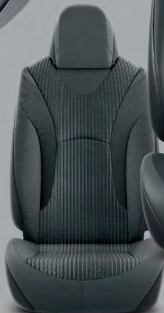
Tyglädsel, svart (FA20) Standard på Active, Executive, Solar Pack