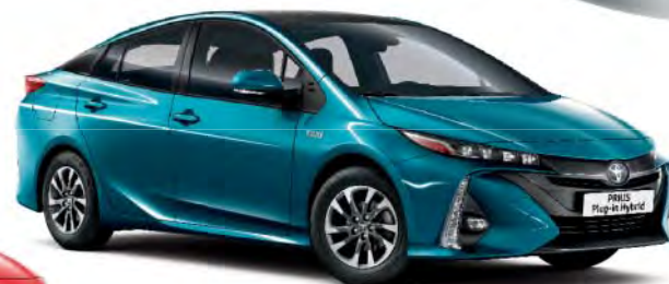
791 Spirited Aqua §