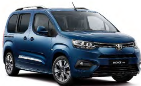
Night Blue (EJG)*