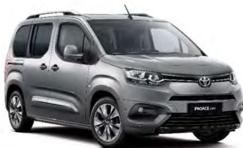
Dark Grey (EVL)*