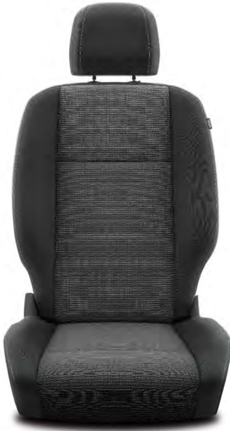
Tygklädsel Toyota Manhattan grå (F7FY) Standard på Active, ActivePlus