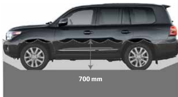
Körning i vatten upp till ett djup på 700 mm