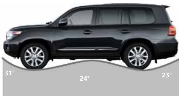
Rampvinkel mellan hjulparen 24° Frigångsvinkel fram 31° Frigångsvinkel bak 23°