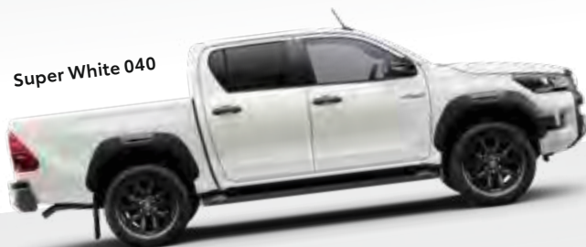
Super White 040