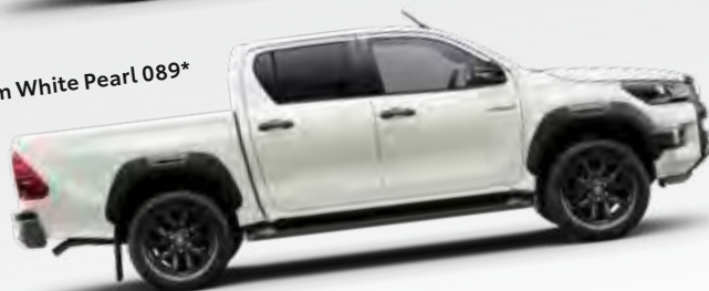
Platinum White Pearl 089*