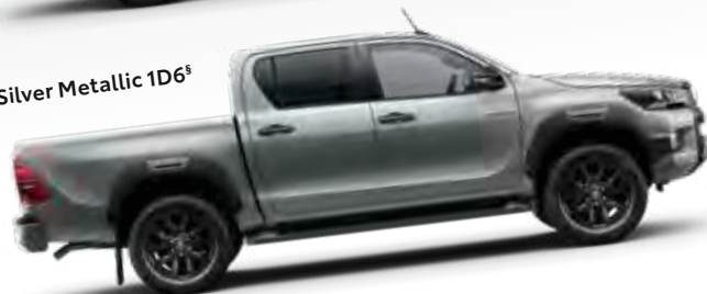
Silver Metallic 1D6 §