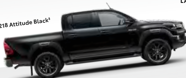
218 Attitude Black §