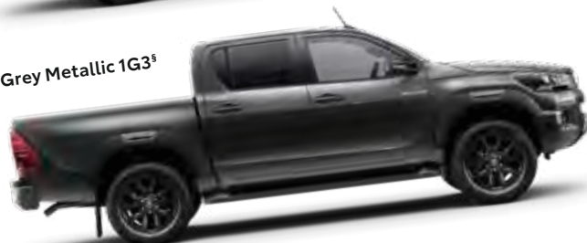
Grey Metallic 1G3 §