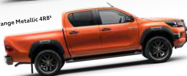
Orange Metallic 4R8 §