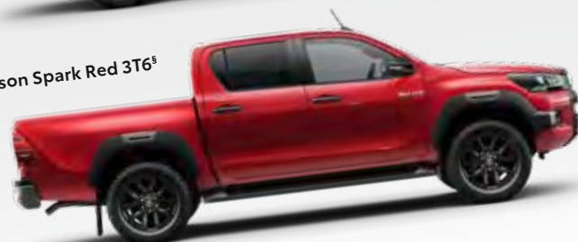
Crimson Spark Red 3T6 §