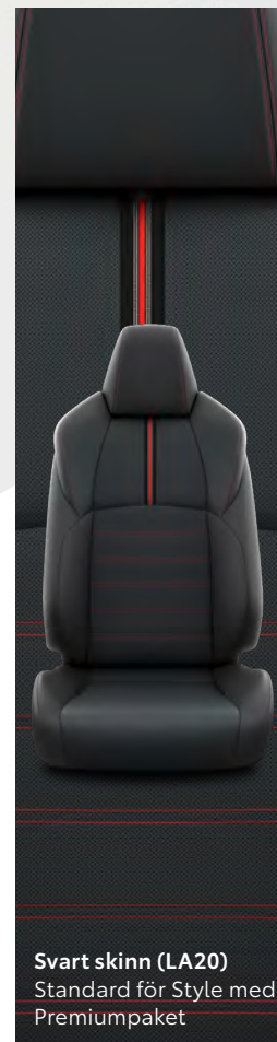
Svart skinn (LA20) Standard för Style med Premiumpaket