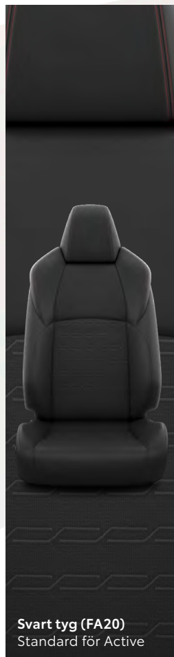
Svart tyg (FA20) Standard för Active