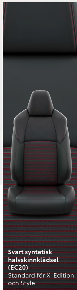
Svart syntetisk halvskinnklädsel (EC20) Standard för X-Edition och Style