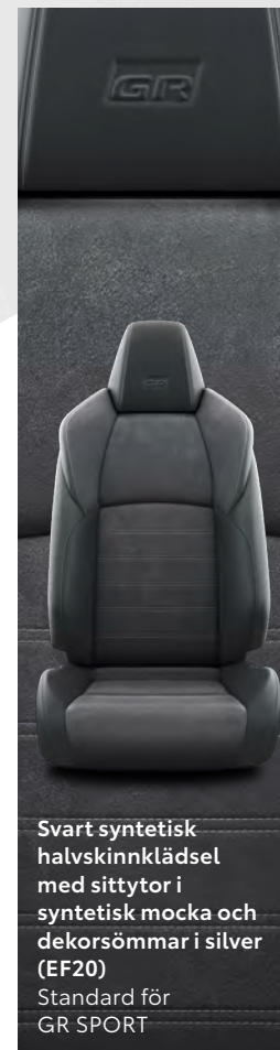
Svart syntetisk halvskinnklädsel med sittytor i syntetisk mocka och dekorsömmar i silver (EF20) Standard för GR SPORT