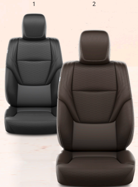
1. Svart läderklädsel 2. Mörkbrun (kastanjeton) läderklädsel