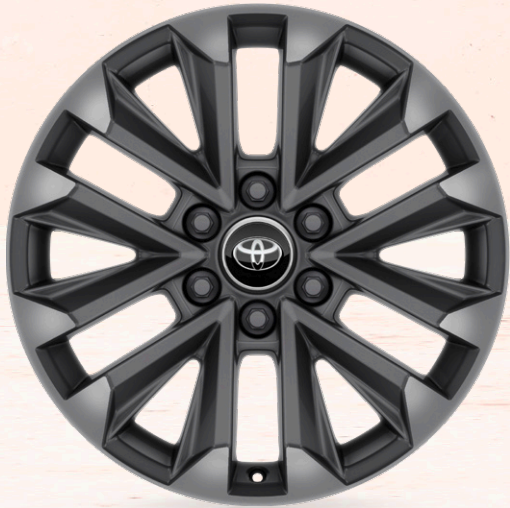
20" lättmetallfälgar matt grå (6-dubbelekrade) Standard