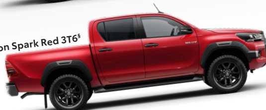
Crimson Spark Red 3T6 §