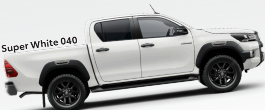
Super White 040