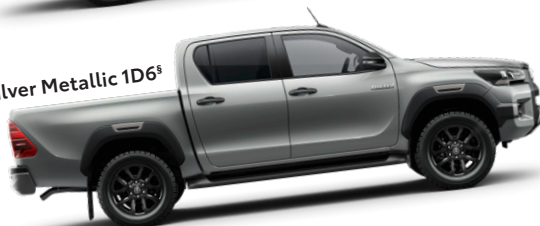
Silver Metallic 1D6 §