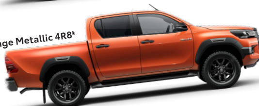
Orange Metallic 4R8 §