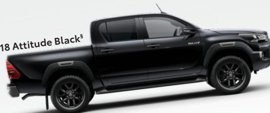
218 Attitude Black §