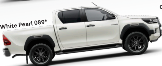
Platinum White Pearl 089 *