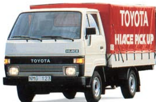
Kapellet på bilden är extra utrustning.

en rak fyra på 1,8 liter, 79 hk och 5 växlar och ger både styrka och bränsleekonomi. Det förmånliga priset, den fina driftsekonomin, 3 års vagnskadegaranti och 6 års rostskyddsförsäkring tillsammans med bilens övriga fördelar gör Hiace Pick-up lätt att äga även om affärerna går tungt.