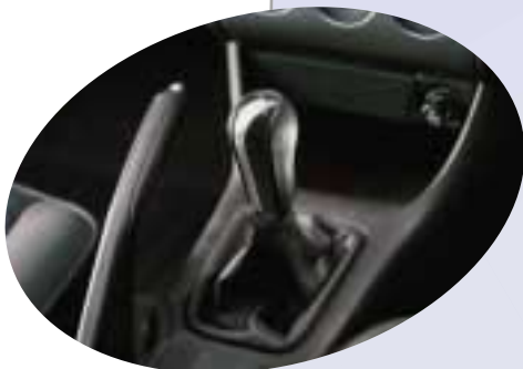
Växelspaksknopp i aluminium/läder.