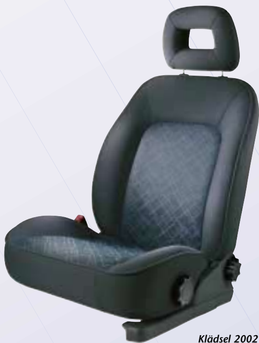
Klädsel 2002 Edition.