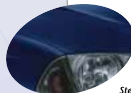
Stellar Blue * 8P4