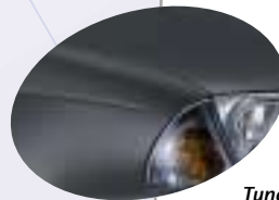
Tundra Grey * 1E5