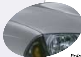
Polar Silver * 199