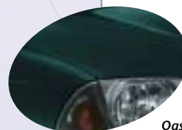
Oasis Green * 6S3