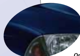
Orion Blue * 8Q4