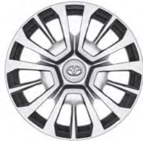
Fälgar 16", stål med hjulsidor (5-trippelekrad) Standard på ComfortPlus