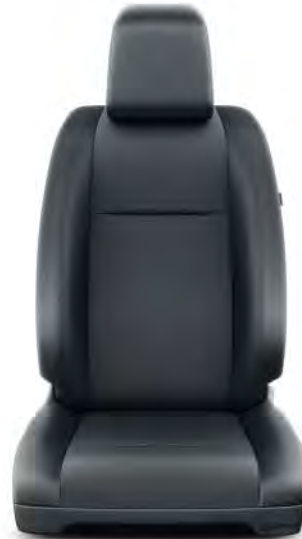
Black PVC (OVFX) Standard på ComfortPlus, Professional