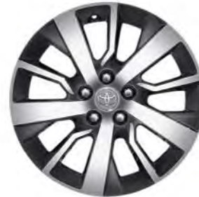
17" lättmetallfälgar (5-ekrade) Standard på Professional