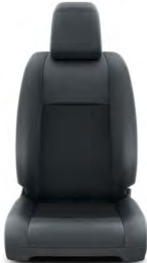
Dark Grey (43FT) Standard på Dubbelhytt