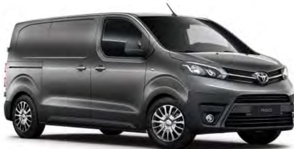
EVL Dark Grey*