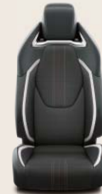
Grått tyg med svarta skinnliknande detaljer Standard på Hybrid GR-S