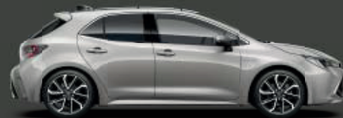
1J6 Precious Silver** ◊