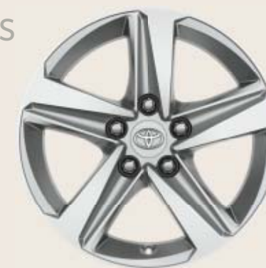
16" silverfärgade lättmetallfälgar Tillbehörsfälg

Även tillgängliga för kompletta vinterhjul.