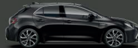
209 Black Mica** ◊