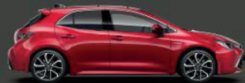
3U5 Emotional Red* ◊