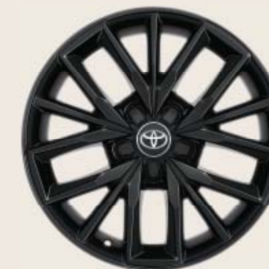
17" svarta lättmetallfälgar Tillbehörsfälg