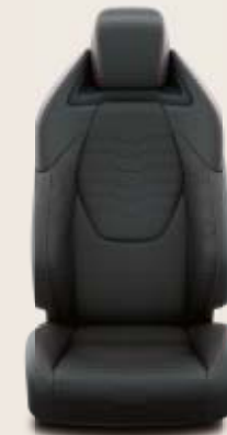
Svart klädsel, halvsinn med Alcantara. Röda sömmar Standard på Executive