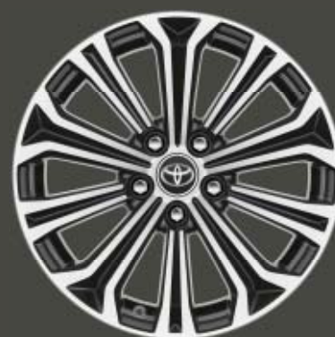
17" svarta lättmetallfälgar med maskinbearbetad yta Standard på Style och Executive (ej 2,0i)