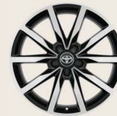
18" svarta lättmetallfälgar med maskinbearbetad yta Tillbehörsfälg