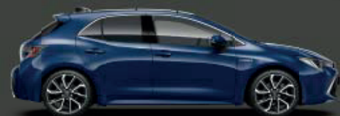
8Q4 Dark Blue/Solid Blue*