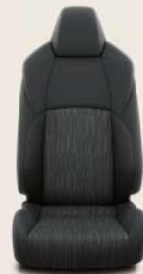
Svart tygklädsel Standard på Life