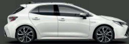
040 Super White 2*