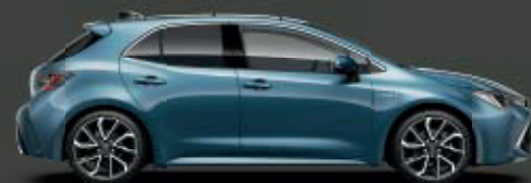
8U6 Blue Metallic* ◊