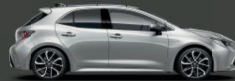
1F7 Silver Metallic* ◊