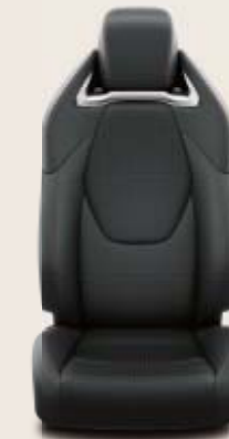
Grått tyg med svarta skinnliknande detaljer Standard på Hybrid GR-S Plus