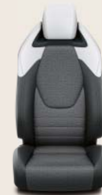
Svart/ljusgrå klädsel, halvsinn med med Alcantara. Grå sömmar Standard på Executive