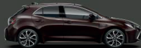
4W9 Phantom Brown* ◊