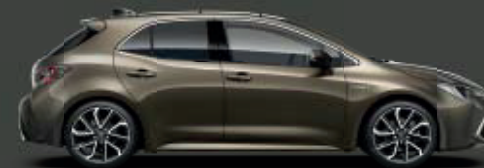
6X1 Oxide Bronze* ◊

Bilderna är illustrationer och avser endast att visa tillgängliga färger.