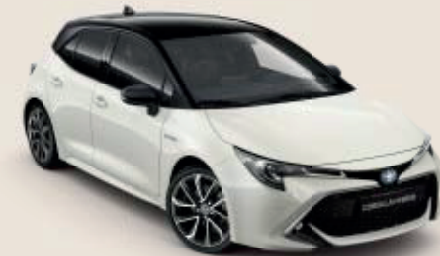
2KR White Pearl §***§§ /Black Mica ◊***§§