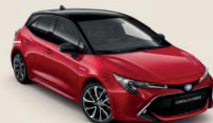
2SZ Emotional Red ◊***§§ /Black Mica ◊***§§