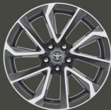
18" grå lättmetallfälgar med maskinbearbetad yta Standard på Executive 2,0i