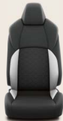
Svart/ljusgrå quiltad tygklädsel med grå sömmar Standard på Active och Style