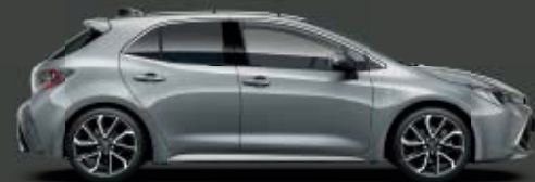
1H5 Manhattan Grey* ◊