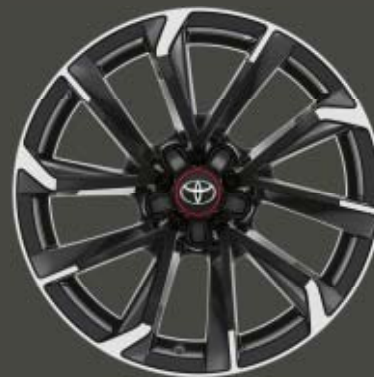
Fälgar 18", lättmetall bi-tone svarta maskinbearbetade (5-dubbelekrade) Standard på Hybrid GR-S Plus