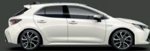
070 White Pearl CS** §