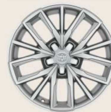
17" silverfärgade lättmetallfälgar Tillbehörsfälg