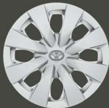
15" stålfälgar med hjulsida Standard på Life