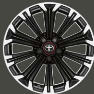
Fälgar 17", lättmetall maskinbearbetade (10-ekrade) Standard på Hybrid GR-S och 1,8 Touring Sports GR-S Plus