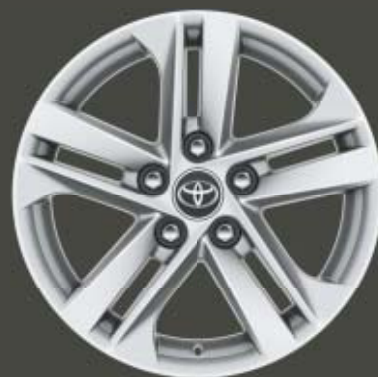
16" silverfärgade lättmetallfälgar Standard på Active