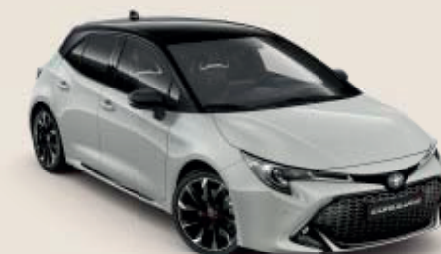
2RZ Ash Grey Metallic/Black Mica ◊***§§