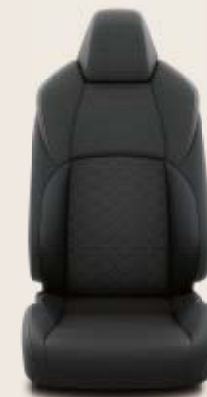
Svart quiltad tygklädsel med grå sömmar Standard på Active och Style