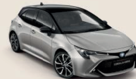
2RD Precious Silver ◊***§§ /Black Mica ◊***§§

Corolla finns i Bi-tone utförande med ett högblankt svart tak och du kan välja en av fem lackfärger för en effektfull kontrast.