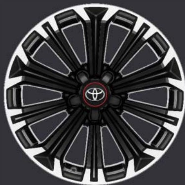
17" maskinbearbetade lättmetallfälgar (10-ekrade) 1,8 GR-S 17" både 5-D och Touring Sports 1,8 Hybrid GR-S Plus Touring Sport 17"