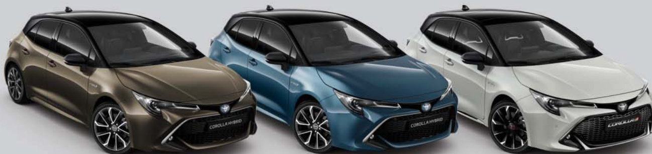
2RF Oxyde Bronze § /Night Sky Black § §§ 1)