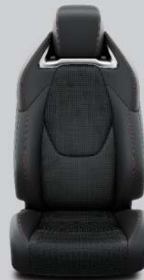
Skinnklädsel Tillval på Hybrid GR-S Plus