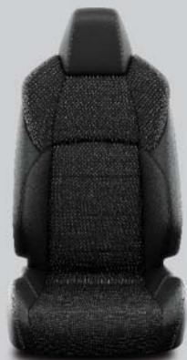
Mörk quiltad tygklädsel och skinnliknande detaljer med grå sömmar Standard på Style