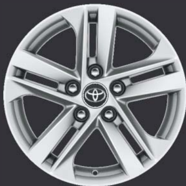
16" silverfärgade lättmetallfälgar Standard på Active