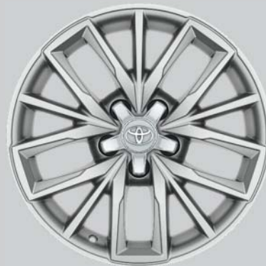
17" silverfärgade lättmetallfälgar Tillbehörsfälg samt kompletta hjul