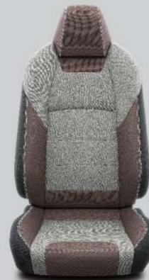
Brun och grått tyg med gråa sömmar Standard på TREK