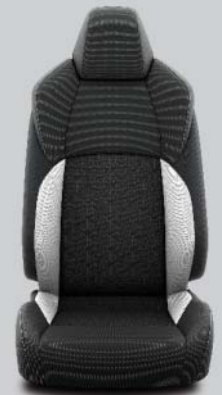
Svart/ljusgrå quiltad tygklädsel med grå sömmar Standard på Life/Active