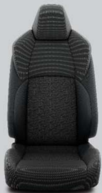
Svart quiltad tygklädsel med grå sömmar Standard på Life/Active