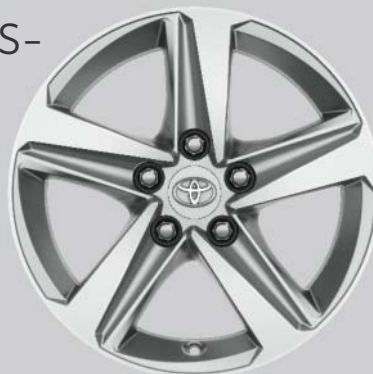
16" silverfärgade lättmetallfälgar Tillbehörsfälg samt kompletta hjul

Även tillgängliga för kompletta vinterhjul.