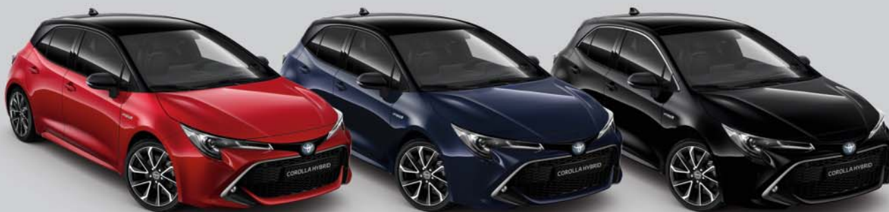
2SZ Flame Red s /Night Sky Black s 0