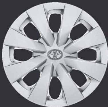
15" stålfälgar med hjulsida Standard på Life