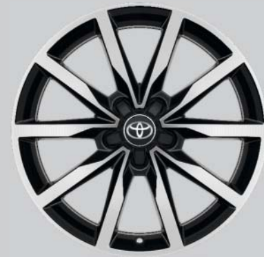
18" svarta lättmetallfälgar med maskinbearbetad yta Tillbehörsfälg samt kompletta hjul