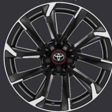
18" maskinbearbetade lättmetallfälgar, bi-tone/svarta (5-dubbelekrade) 1,8 Hybrid GR-S Plus 18" 5-D 2,0 Hybrid GR-S Plus 18" både 5-D och Touring Sports