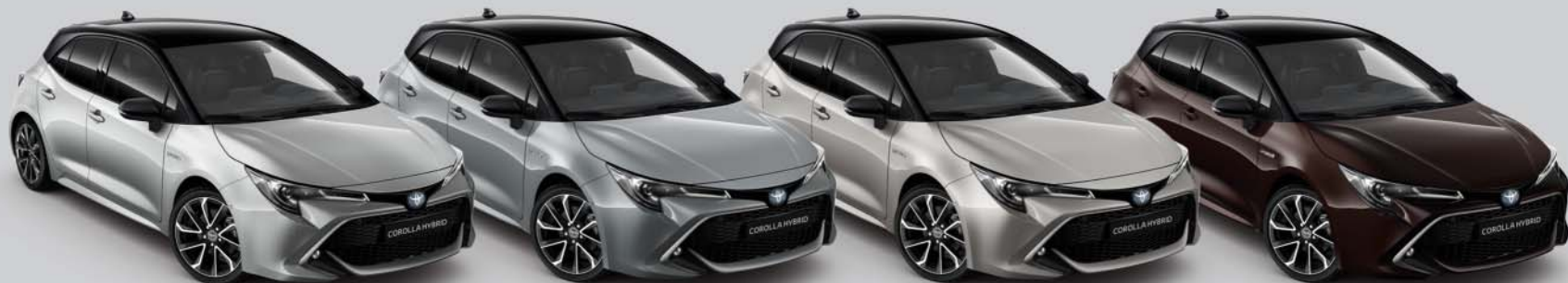
2KS Ultra Silver s /Night Sky Black s 0