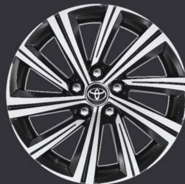
17" svarta lättmetallfälgar med maskinbearbetad yta. (10-ekrade) Standard på Style