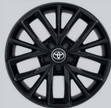
17" svarta lättmetallfälgar Tillbehörsfälg