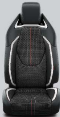
Grått tyg med svarta skinnliknande detaljer Standard på GR Sport och GR Sport Plus