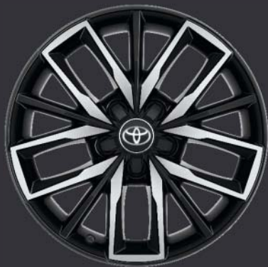
17" svarta lättmetallfälgar med maskinbearbetad yta Standard på TREK