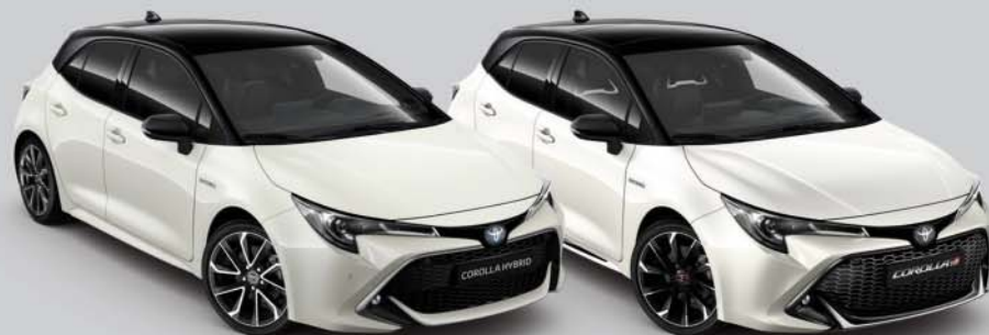
2KR Pearl White * /Night Sky Black § °